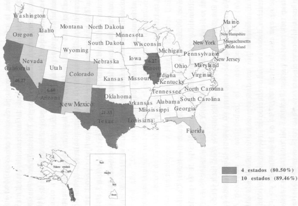
Mapa 4 Distribución geográfica por estados según grado de concentración

En tercer lugar, que la localización de concentraciones de población mexicana en Estados Unidos, permite organizar las elecciones y